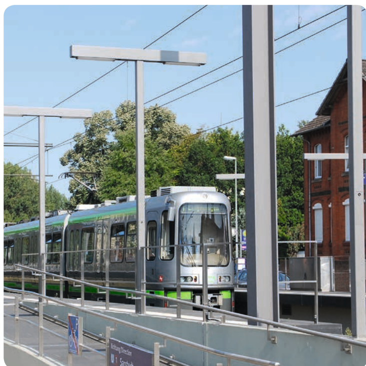
Stand: 18. Oktober 2018