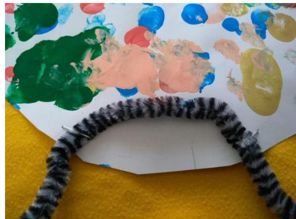
Pfeifenputzerbeinchen am Bauch festgetackert