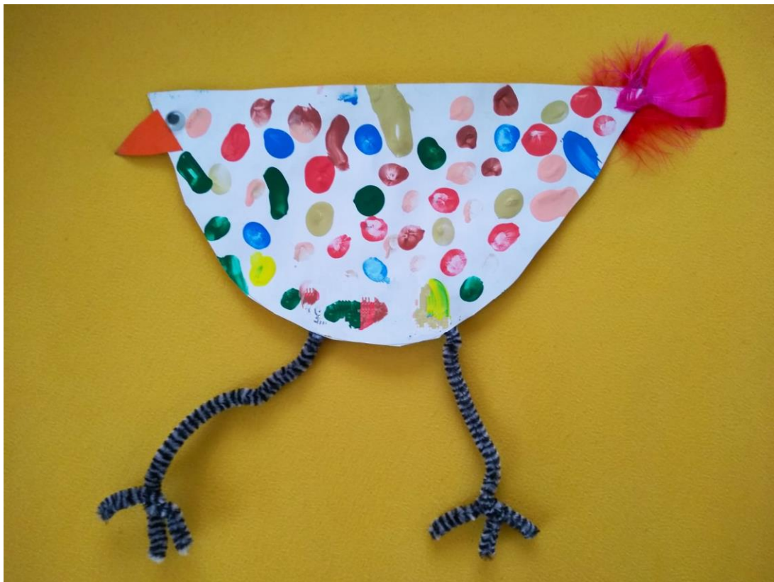
Euer Huhn ist fertig 😊