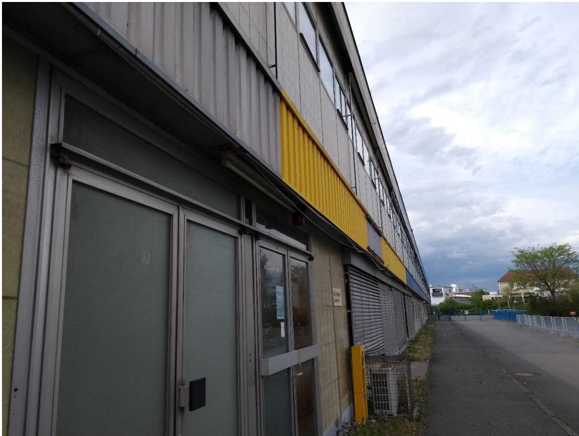
Abbildung 6: Gebäudefassade mit Quartierpotenzial