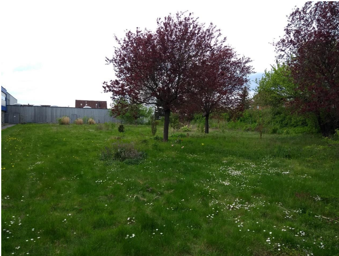
Abbildung 4: Gartenstruktur im Norden der Planfläche

bietet (Abb. 4). Bei der Begehung konnten 5 Haussperlinge ( Passer domesticus ) bei der Nahrungssuche beobachtet werden. Es wurden keine Nester in den dort befindlichen Bäumen gesichtet. Da das Vorhaben erst im kommenden Jahr beginnt, lässt sich ein negativer Einfluss auf evtl. Brutplätze zu diesem Zeitpunkt jedoch nicht ausschließen. Des Weiteren sind die Hecken sowie die darin befindlichen Kiefern am südlichen Rand des Grundstücks für Gehölzbrüter attraktiv (Abb. 5). Hier wurde eine Blaumeise ( Cyanistes caeruleus ) mit Nistmaterial im Schnabel gesichtet. Eine Zerstörung von Niststätten ist vor Baubeginn durch eine Begehung auszuschließen.