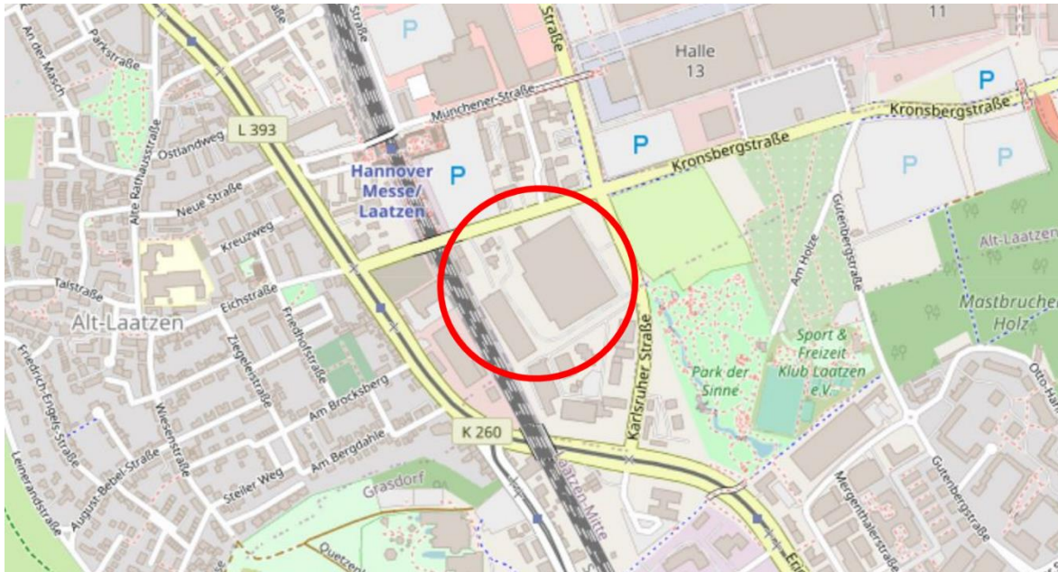
Abbildung 1: Lage des Untersuchungsgebiets (roter Kreis).