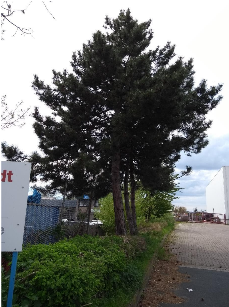
Abbildung 5: Hecken und aufgewachsene Einzelbäume im Süden der Fläche

Die Gebäude (Gewerbehallen) weisen durch viele Dachüberstände und Außenjalousien sowohl Potenzial für Gebäudebrüter als auch für Fledermäuse auf (Abb. 6). Da gebäudebrütende Vögel vorwiegend Spalten im Mauerwerk und Löcher in Außendämmungen nutzen, ist die Eignung der Gewerbehalle für Vögel als gering einzuschätzen. Es konnten keine brütenden Vögel am Gebäude beobachtet werden. Die Nutzung der vorhandenen Nischen durch Fledermäuse ist möglich, kann aber nur durch eine spezielle Untersuchung mit Hilfe eines Detektors überprüft werden.