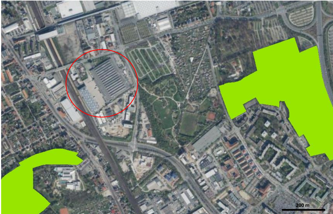
Abbildung 3: Schutzgebiete (grün) und Plangebiet (rote Markierung).

Neben den raumordnerischen Plänen wurden die behördlichen Daten zu planungsrelevanten Arten gesichtet. Die vollständige Liste aller planungsrelevanten Arten der Avifauna Niedersachsens kann über den NLWKN eingesehen werden. In Niedersachsen stehen insgesamt 389 Arten unter besonderem oder strengem Schutz (Stand 2008). Darunter sind 212 heimische Brutvögel. Potenziell kommen im Gebiet Arten der Habitatkomplexe „Gehölze“ (122 Arten) und Gebäudebrüter (17) vor. Zudem müssen Hinweise auf 10 mögliche Gebäude bewohnende Fledermausarten untersucht werden. Bei den in Frage kommenden Arten handelt es sich um eine theoretische Abschichtung, das tatsächliche Potenzial kann nur bei einer Geländebegehung eingeschätzt werden.